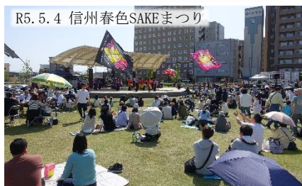
R5. 5. 4 信州春色SAKEまつり

⑦公園のどこからも園内を見渡せ、遠方に望む山々に信州の自然を感じる、長野駅東口のシンボルとして、これまでにない都市空間を創造しています。