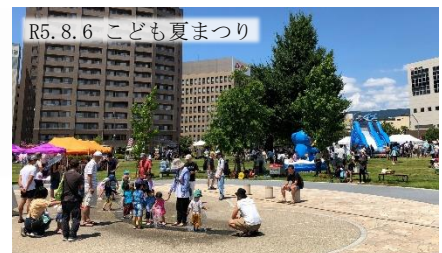
R5. 8. 6 こども夏まつり

◆長野駅から徒歩5分の良好な立地により、イベントの開催時には多くの市民が訪れる公園です。